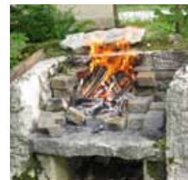
possibilité de griller