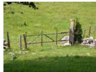
magnifiques parcours de randonnées